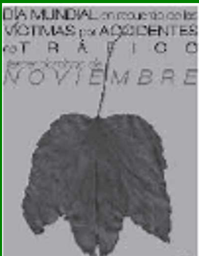
交通事故犠牲者の日を宣伝する スペインのポスター

毎年、世界中では120万人の人々が交通事故で命を落とし、その背後に破壊された家族と地域社会を残している。死亡例のほとんどは若年者であり、彼らの人生の最も花である時期であり、家族や地域社会にとっては彼らの貢献と存在そのものが非常に大切なものなのである。このような痛ましい出来事の影響は、苦悩がさらに蓄積されてゆくことでより重大なものとなっている。すでに何百万人も苦しんでいる人々の上に、さらに毎年何百万人も犠牲者が加算され、喪失した者に対する他者の不適切な反応によってさらに苦悩が増強されるという、まさに想像を絶するものとなっている 1, 2, 3, 4 )。持続する情緒的・精神的な苦しみはもちろん、家族の一員を失ったことで家族に相当な経済的負担がのしかかる。多くの国で、長引く医療費、一家の大黒柱を失ったこと、障害者をケアするための資金などで、しばしば家族は貧困へと転落させられる 1, 2, 3, 5, 6 )。問題の大きさにもかかわらず、交通事故による死亡、受傷、犠牲者の苦悩などの問題は今までほとんど無視され続けてきた 1, 2, 3, 5, 7, 8, 9 )。仲間である犠牲者に支援を行ってきたのは主に非政府組織の犠牲者組織だけだったし、交通事故によって引き起こされる極限の肉体的苦悩と社会の無関心に焦点を当てて人々の態度を変えようと努力してきたのもこれらの組織であった。年に一度、交通事故犠牲者を思い出す日を設定してこれらの犠牲者組織が記念する運動は1993年にイギリスで始まった。交通事故による死亡や負傷で壊滅的影響を受けること、支援が欠如していることを、より広く訴えるためである。この記念日は、今日では世界中に広がってきている。